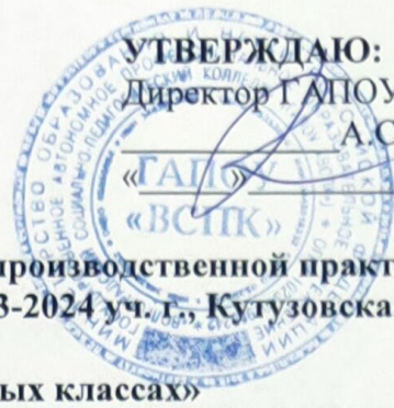
График сроков прохождения учебно-производственной практики на очном отделении 2023-2024 уч. г., Кутузовская,5.

Специальность: 44.02.02 «Преподавание в начальных классах»